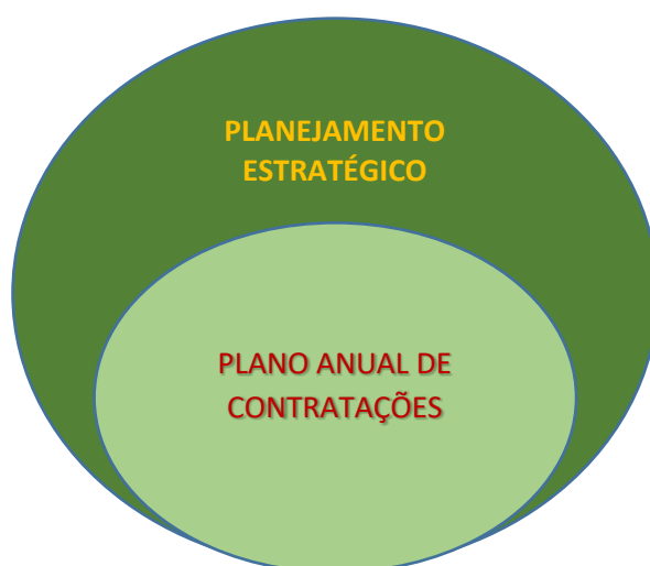
Figura: PAC como ferramenta colaborativa do PE

Portanto, pode-se verificar que o PAC está em perfeito sincronismo com Planejamento Estratégico da Instituição, visto que as Contratações, sejam de bens e serviços, obras, serviços de engenharia e contratações de soluções de tecnologia da informação e comunicações, dão suporte a todos os objetivos estratégicos que se encontram no Mapa Estratégico do IFMA, com maior ênfase, no objetivo “Adequar e consolidar a infraestrutura acadêmica, administrativa e tecnológica” (Perspectiva Gestão de Pessoas e Infraestrutura) e no objetivo “Otimizar a aplicação de recursos orçamentários e captar recursos externos” (Perspectiva Orçamento).