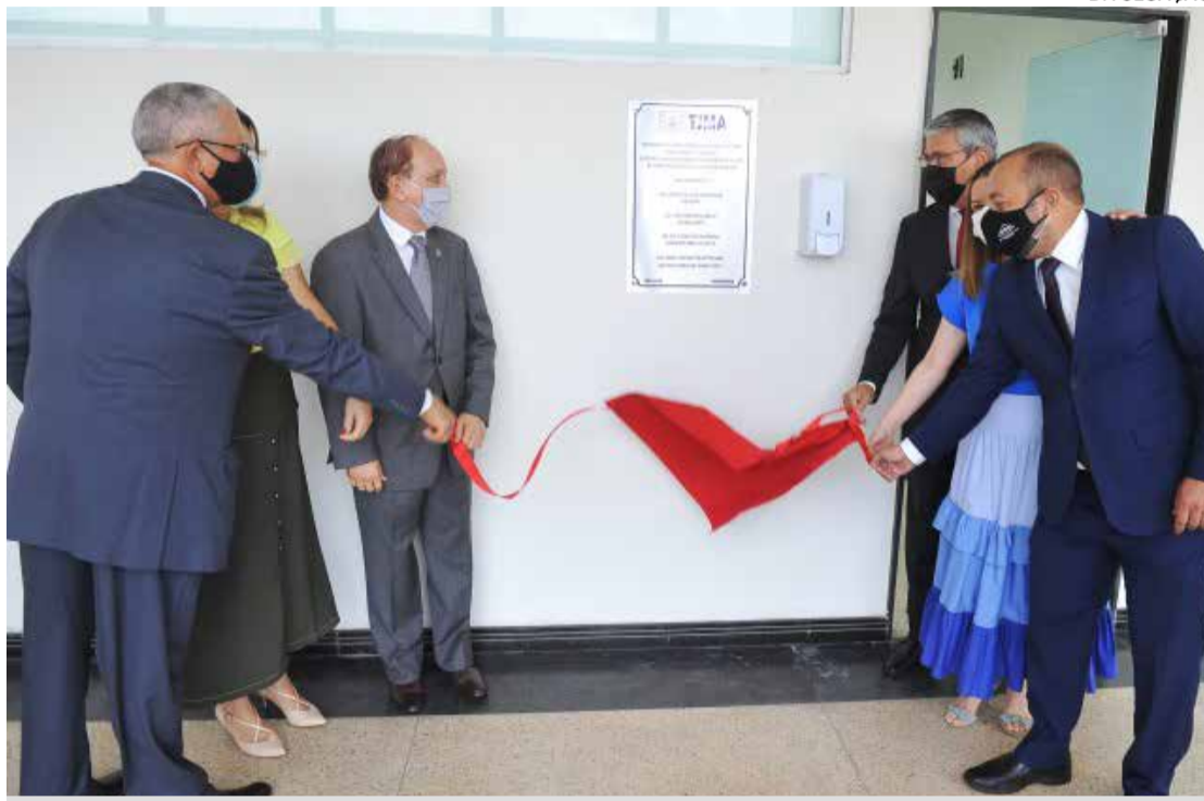
A nova unidade está localizada no Fórum Desembargador Sarney Costa