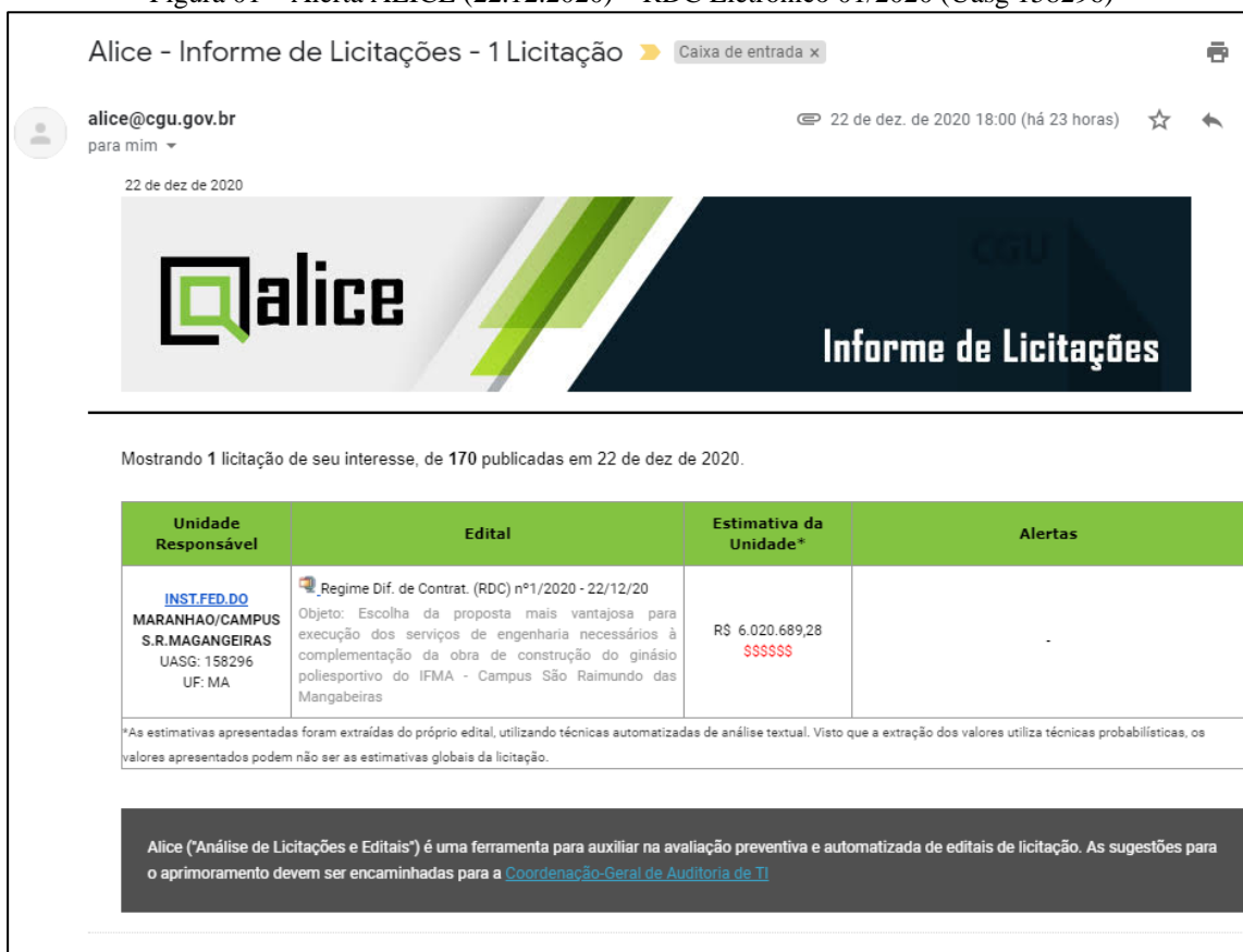
Figura 01 – Alerta ALICE (22.12.2020) – RDC Eletrônico 01/2020 (Uasg 158296)

1. Cuida-se de ação preventiva emitida pela Controladoria Geral da União (CGU), mediante “disparo de alerta” do software de controle preventivo - ALICE, acerca do RDC Eletrônico n°. 01/2020 (UASG 158296 – IFMA/Campus São Raimundo das Mangabeiras, cujo objeto trata da escolha de proposta mais vantajosa para execução dos serviços de engenharia necessários à complementação da obra de construção do ginásio poliesportivo do Campus – Valor estimado de R$ 6.020.689,28) – Data de abertura: 14.01.2020 (às 10:00h).