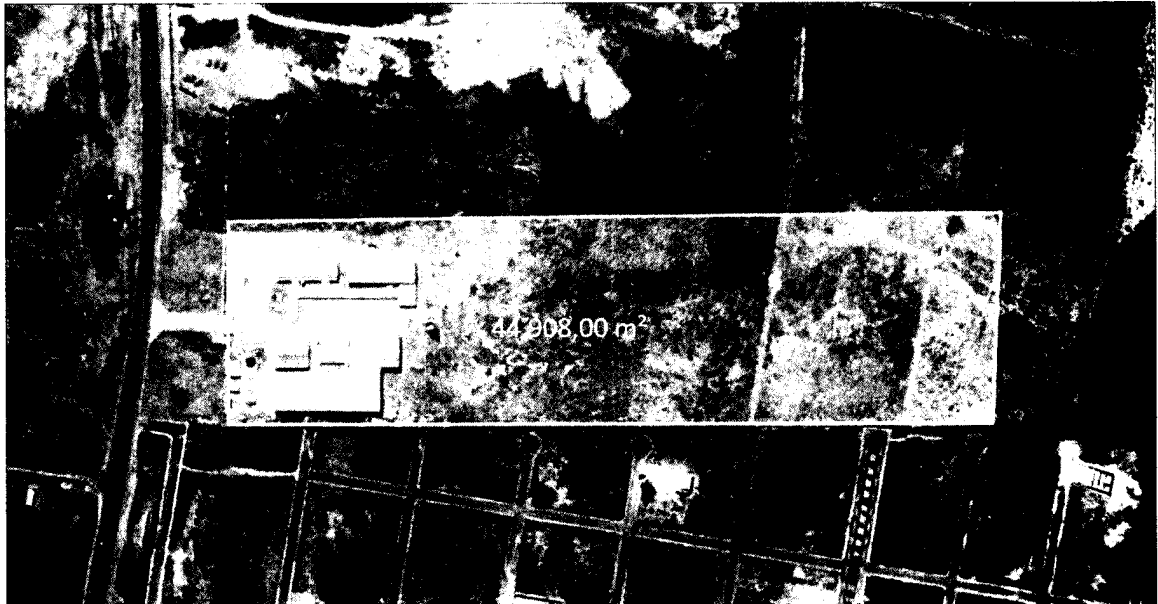
Figura 1: Vista aérea do campus.

do qual, a contratação de empresa especializada se torna essencial para suprir a demanda por hora levantada pelo IFMA Campus Presidente Dutra.