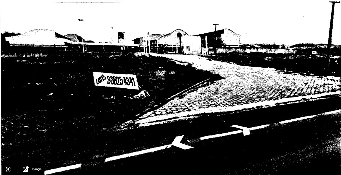
Figura: Vista Frontal do Campus

3.8. O objeto final a ser entregue são: 2 vias impressas (preferencialmente em folha formato A1) e em formato digital com a planta topográfica proveniente do levantamento constando, as curvas de nível de 0,25 m em 0,25 m, as poligonais referente aos arruamentos, muro, edificações existentes, postes, sumidouros, caixas de passagem/inspeção e demais detalhes existentes no terreno levantado, estando todos os objetos no desenho corretamente georreferenciados. Os outros arquivos são (preferencialmente em folha no formato A4) o memorial descritivo do levantamento, monografias dos pontos base implantados (mínimo 2) e ART de execução devidamente paga, emitida pelo profissional responsável pelo levantamento. Deverão ser disponibilizados também os arquivos referentes ao ajustamento das observações e a nuvem de pontos (em .kml, .dxf, .txt e .xlsx).