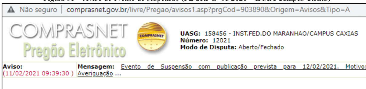
Figura 01 – Aviso de evento de suspensão (PE SRP nº 01/2021 – IFMA/Campus Caxias)

2. Esta unidade de auditoria interna orienta pelo seguimento da contratação pleiteada, caso ainda seja de interesse da unidade, não deixando o Campus de publicar no portal do IFMA (Seção de Licitações) toda documentação relacionada ao processo licitatório ora citado.