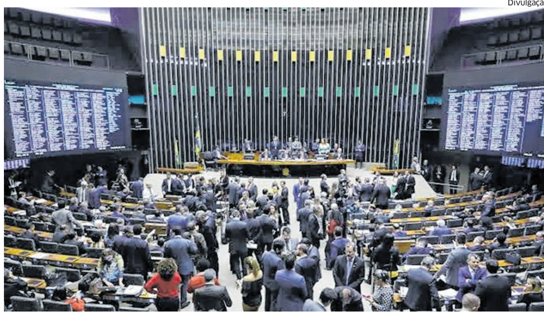
Deputados federais modificaram proposta e aprovaram texto no fim da noite da última quarta-feira, 4

Eduardo Braide (Podemos) destacou o combate à corrupção e ao